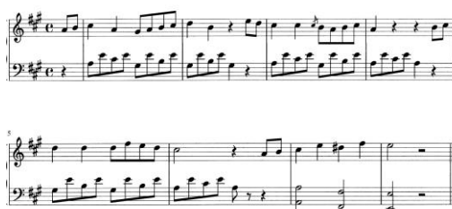
Ex. 4. Air Grec, Ms.R. 2663, p.91